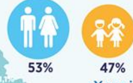
ВІКОВИЙ РОЗПОДІЛ ДЗВІНКІВ